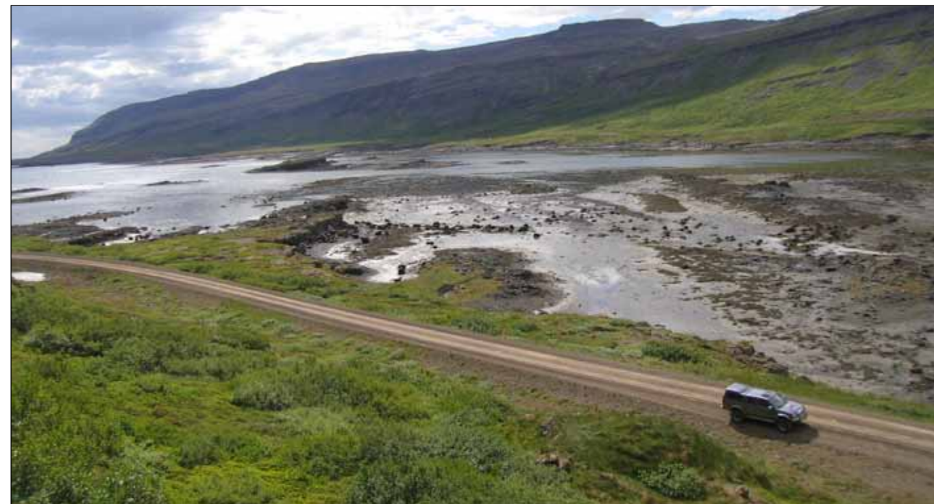
Möguleg þverun Kjálkafjarðar verður utan við leirurnar (Ljósmynd: Böðvar Þórisson, 2008).

ennþá 138 km af malarvegum á Vestfjarðavegi og er sums staðar um erfiða fjallvegi að fara sem lokast auðveldlega að vetrarlagi. Með göngum á milli Arnarfjarðar og Dýrafjarðar sem stytta leiðina um 27 km verður þessi leið, þ.e. um Vestfjarðaveg, stysta leiðin á milli Ísafjarðar og Reykjavíkur. Með fjarðarþverunum við norðanverðan Breiðafjörð eru áform um að stytta leiðina meira, þannig að hún verði að lokum aðeins rúmlega 400 km.