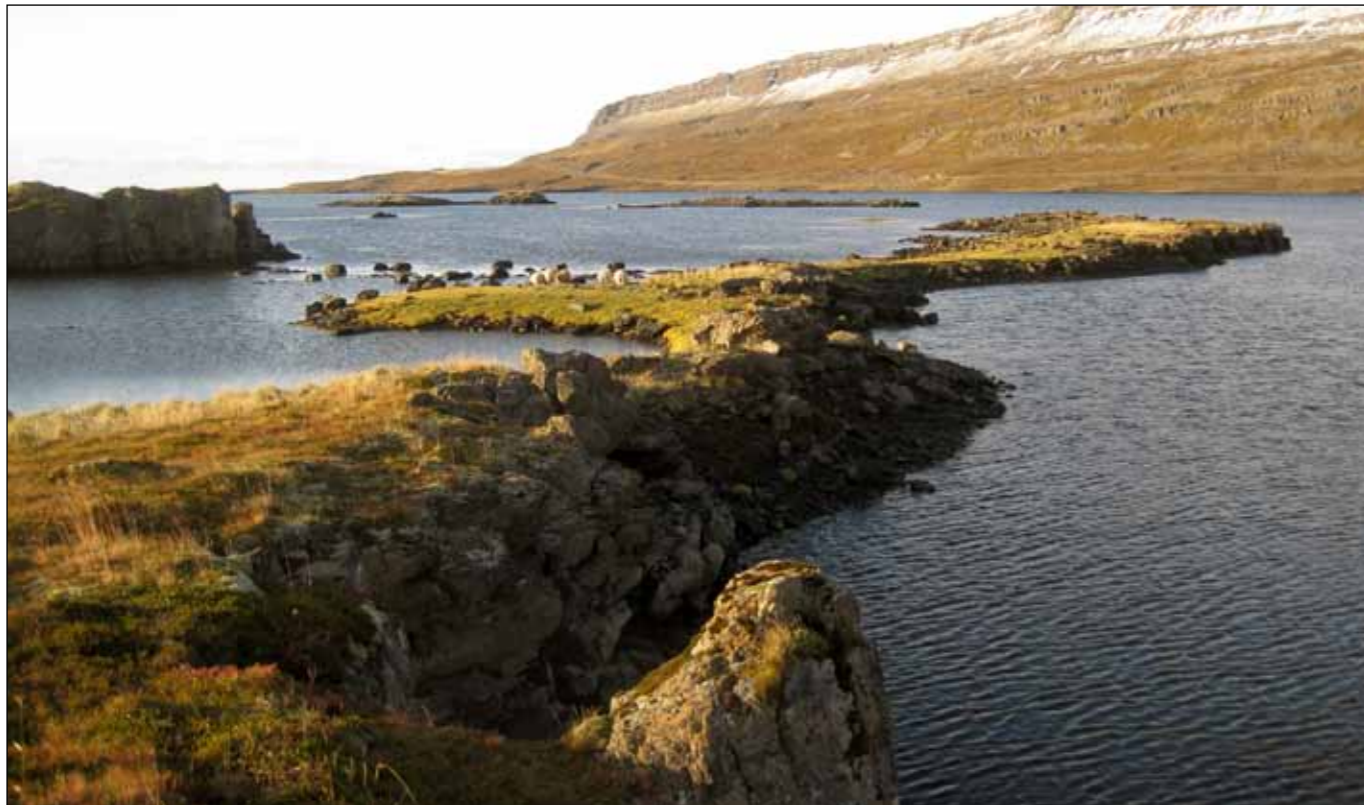
Í grennd við mögulega þverun Mjóafjarðar samkvæmt veglínu A.

og nes í austanverðum firðinum með sömu áhrifum og á leiruna. Með því að færa veglínuna utar skerðist minna af leirunni. Snjóöfnunin undir hlíðinni í austanverðum firðinum skiptir ekki máli ef línurnar eru færðar utar. Þessi þverun er liðlega 0,8 km styttri en aðrir kostir sem voru skoðaðir innan í firðinum.