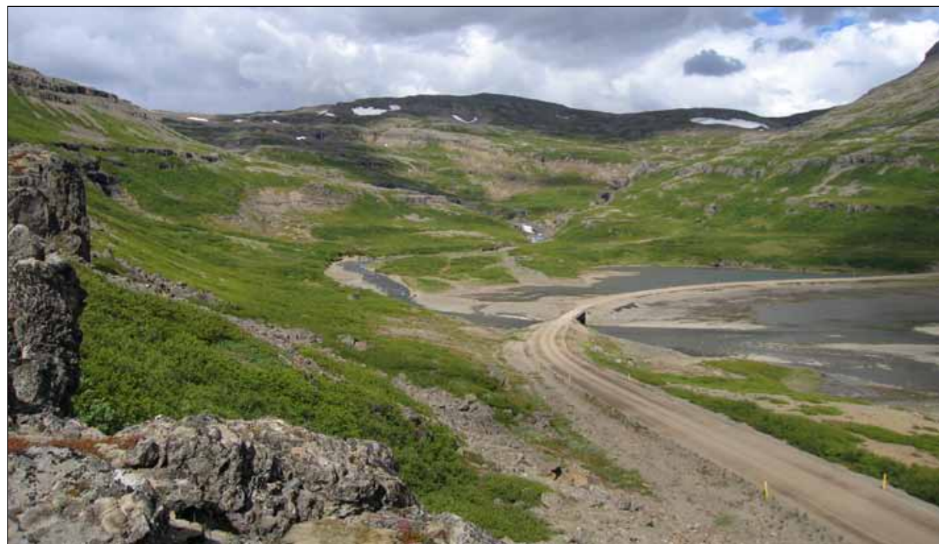
Núverandi vegur í botni Kjálkafjarðar (Ljósmynd: Böðvar Þórisson, 2008).

Í undirbúningi og í framkvæmd eru í miklar vegabætur á Vestfjarðavegi til að tengja saman byggðarlög og til að hægt verði að fara hringleið um Vestfirði á bundnu slitlagi, allan ársins hring. Eins og kemur fram hér að framan eru