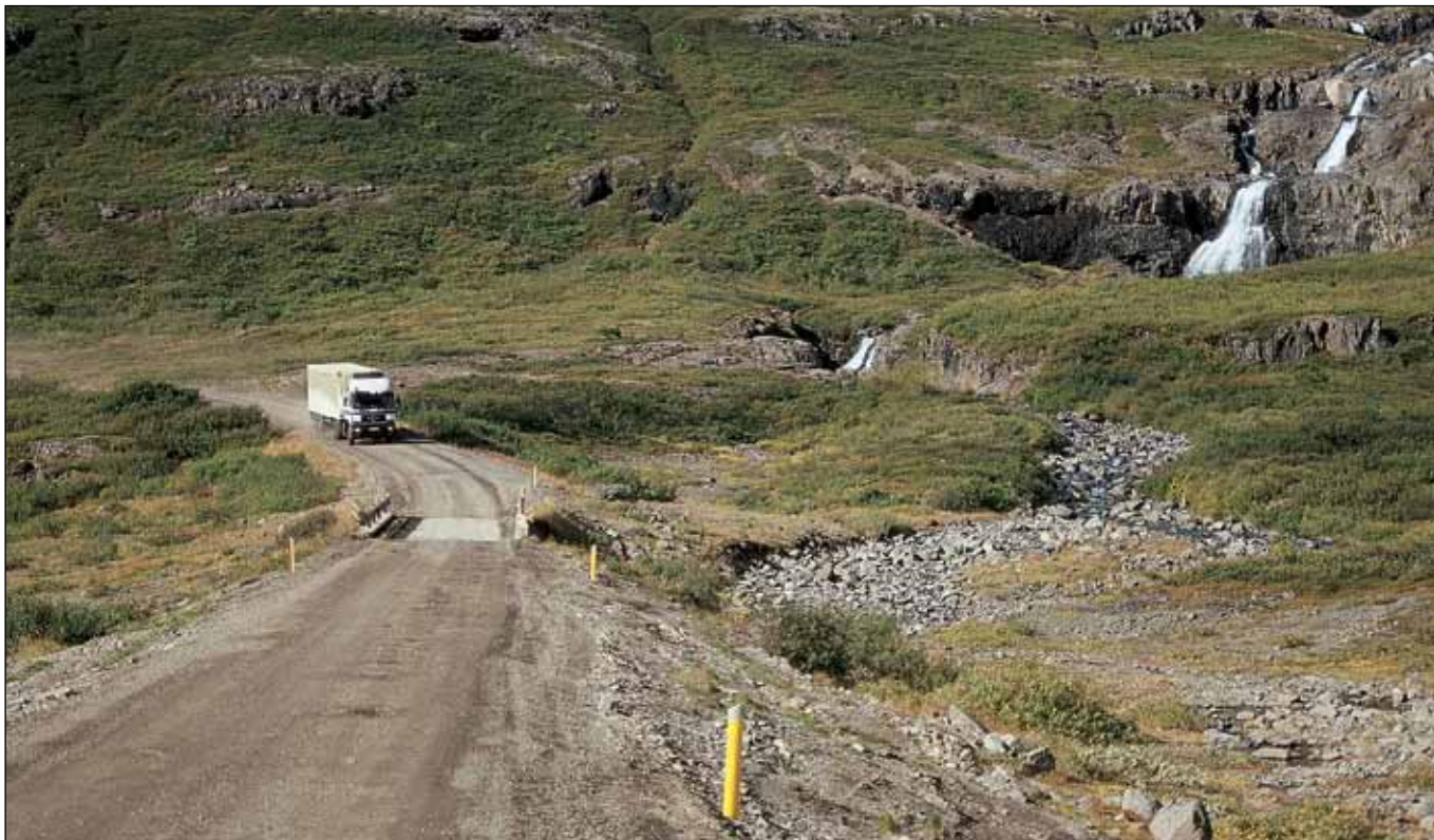
Vestfjarðavegur (60) í Mjóafirði. Nú er unnið að mati á umhverfisáhrifum vegna endurbóta á þessum vegi.